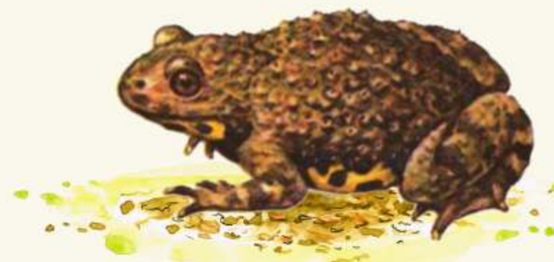
K kuňka žlutobřichá ( Bombina variegata )

- aktivní zvíře, které spí jen asi 80 minut denně. Samičí jelena je laň, jelen se pyšní krásným parožím.