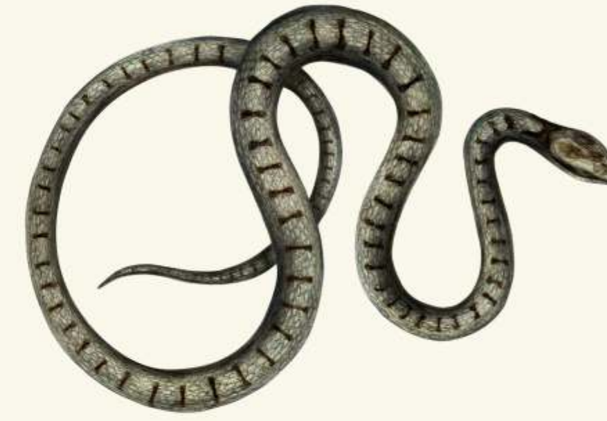
G užovka hladká ( Coronella austriaca )

- podobná violce lesní, má větší světle modré nebo fialově-modré květy. Vyskytuje se v listnatých lesích. Kvete od dubna do května..