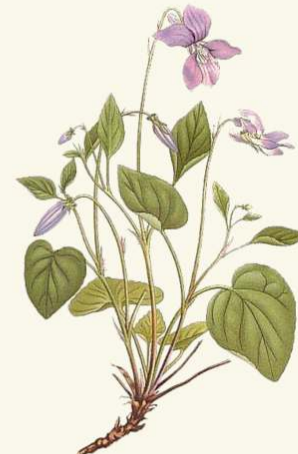
F violka Rivinova ( Viola riviniana )

- ve dne loví ryby, hmyz a malé savce. Její peří bývalo kdysi ozdobou dámských klobouků. Přísně chráněný druh.