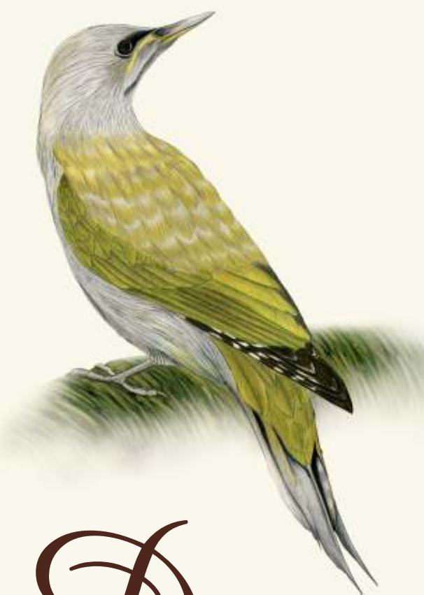
D žluna šedá ( Picus canus )

- patří k zimujícím druhům. Nejčastěji jej spatříme v blízkosti smrků. Zpěv připomíná zvuk flétny.