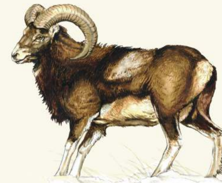
M muflon ( Ovis musimon )

- nejmenší evropská šelma. Rychle běhá, šplhá po stromech a plave. Její oblíbenou pochoutkou jsou ptačí vejce.