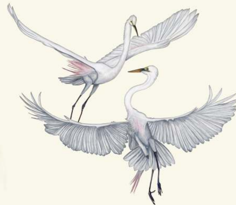
E volavka bílá ( Ardea alba )

- dlouhý, lepivý jazyk jí umožňuje vytahovat mravence z mravenišť. Během zimy je častým návštěvníkem krmítek.