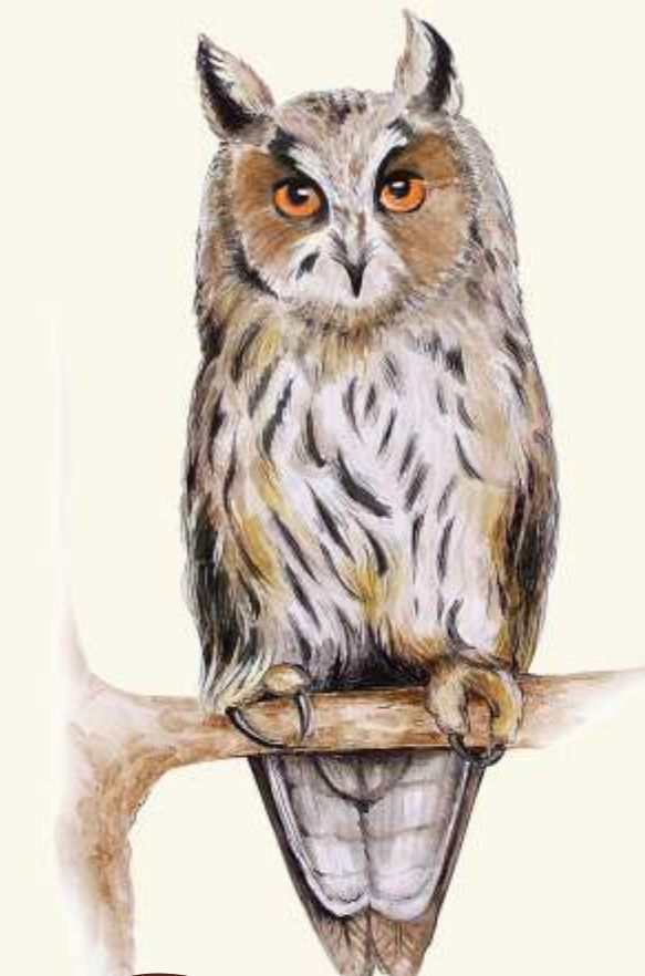
U kaalous ušatý ( Asio otus )

- ocasatý suchozemský obojživelník. V noci opouští svůj úkryt a loví hmyz, pavouky a slímáky.