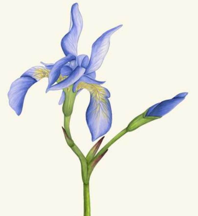
I řosatec sibiřský ( Iris sibirica )

- hnízdí v lesích na vysokých stromech. Rozpětí jeho křídel dosahuje 190 cm.