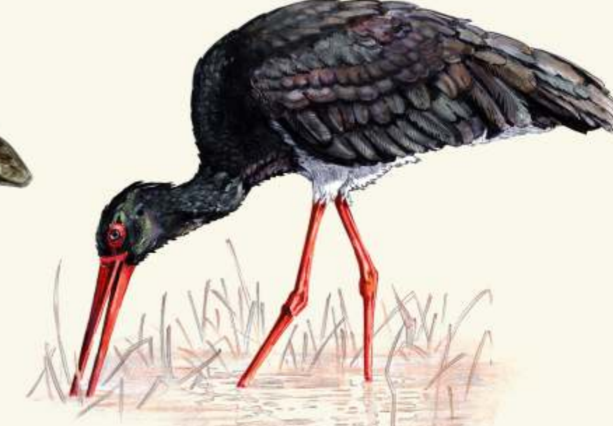
H čáp černý ( Ciconia nigra )

- nejedovatý had žijící skryt mezi rostlinami. Během dne se často vyhřívá na osluněných svazích.