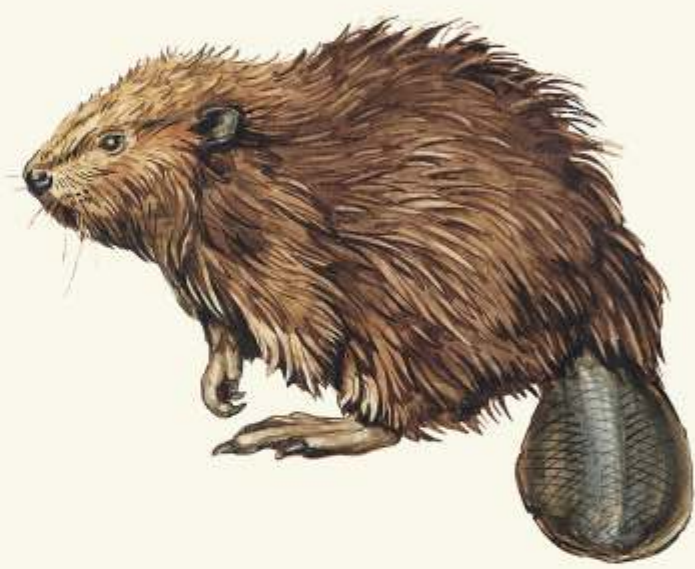
B bobr evropský ( Castor fiber )

- menší, jedovatý keř s nádherně vonícími květy. Původně se vyskytuje v rezervaci u Ležajska.