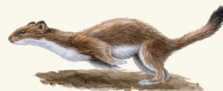
L lasice koččava ( Mustela nivalis )

- intenzivní vůni květů s nápadnými skvrnami láká hmyz k opylování. Častá inspirace umělecké rukodělné tvorby. V okolí Opavských hor lze najít rostliny s bílými květy. Přísně chráněný druh.