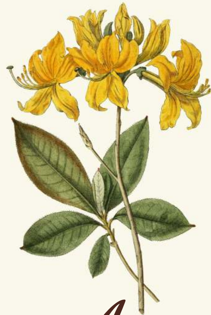
A pěnišník žlutý ( Rhododendron luteum )

- menší, jedovatý keř s nádherně vonícími květy. Původně se vyskytuje v rezervaci u Ležajska.