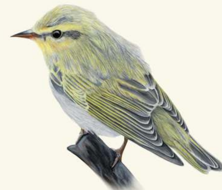
Š budníček lesní ( Phylloscopus sibilatrix )

- největší evropský ocasatý obojživelník, útokům se brání vylučováním jedu.