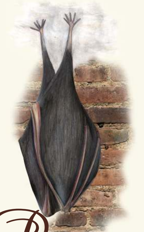
P vrápenec malý ( Rhinolophus hipposideros )

- patří k tažným druhům ptáků. Jeho zpěv inspiroval Ludwiga van Beethovena ke složení Symfonie č. 5.