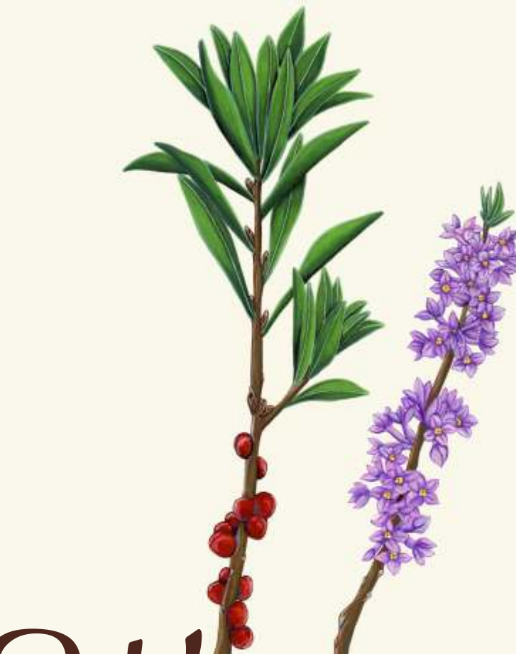
W lýkovec jedovatý ( Daphne mezereum )

- během mrazivých zim se kaalousi srocují do skupin čítajících až 30 jedinců.