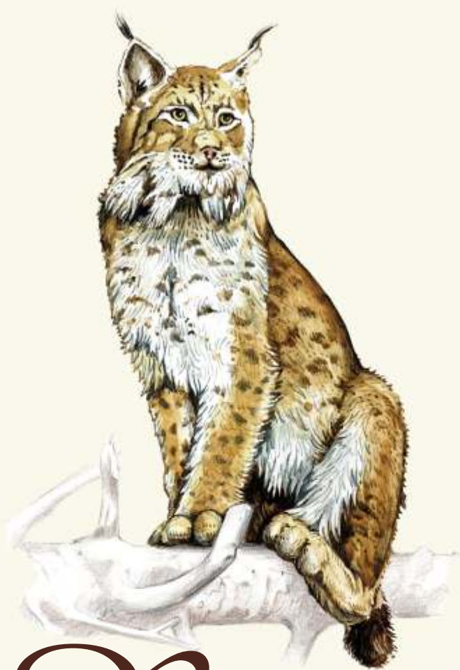
R rys ostrovid ( Lynx lynx carpathicus )

- malý netopýr s echolokačními schopnostmi. V oblasti nozder má hrbolek ve tvaru podkovy.