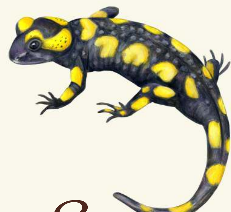
S mlok skvrnitý ( Salamandra salamandra )

- aktivní především v noci. Na konci uší má černé chomáčky chlupů, tzv. chvostky, díky nimž lépe slyší.