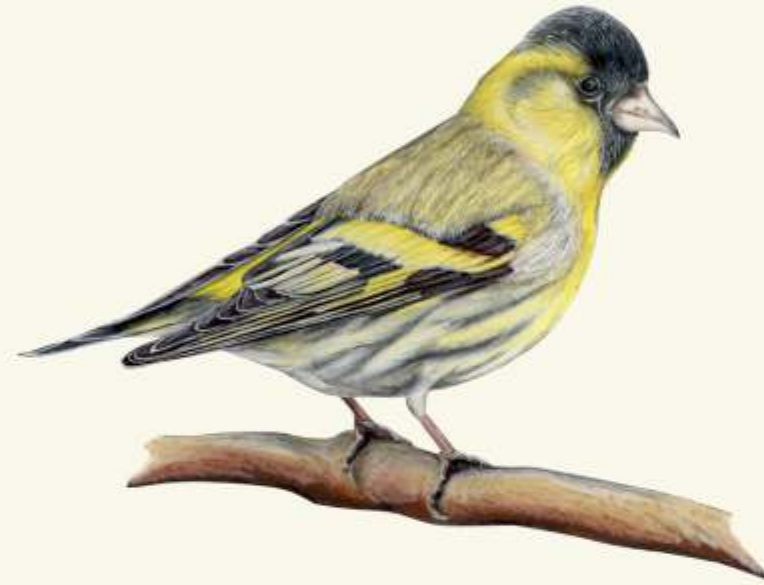
C čížek lesní ( Spinus spinus )

- největší evropský hlodavec. Jeho poznávacím znamením jsou hráze a hrady, které staví z větví, kamenů a bahna.