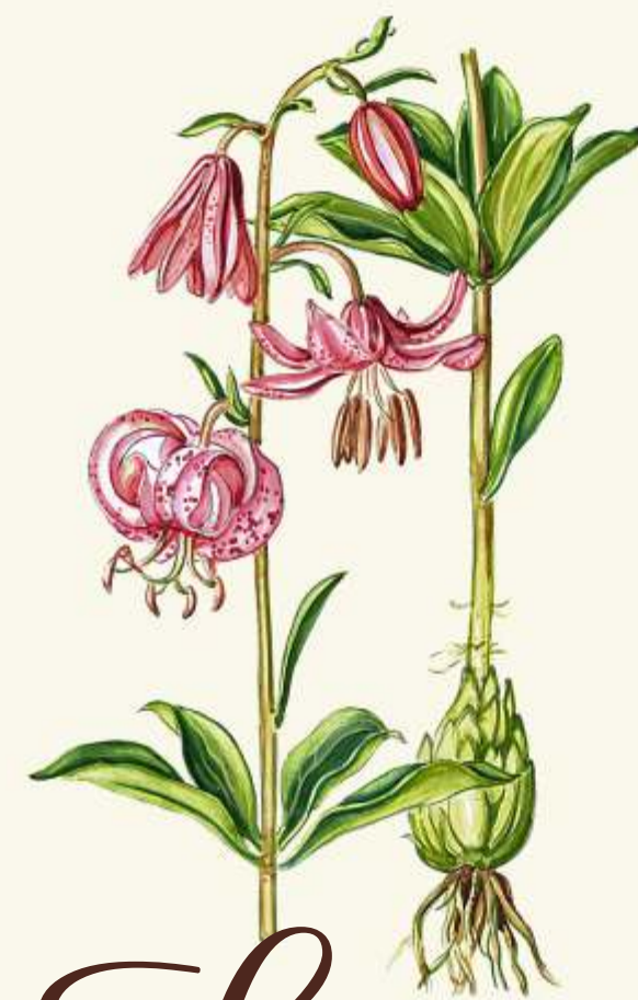
L lilie zlatohlávek ( Lilium martagon )

- na zimu zalézá do nor a škvír. Během páření na jaře se ozývá hlasitým „kum kum“. Má charakteristické skvrnitě, žluto-oranžové břicho.