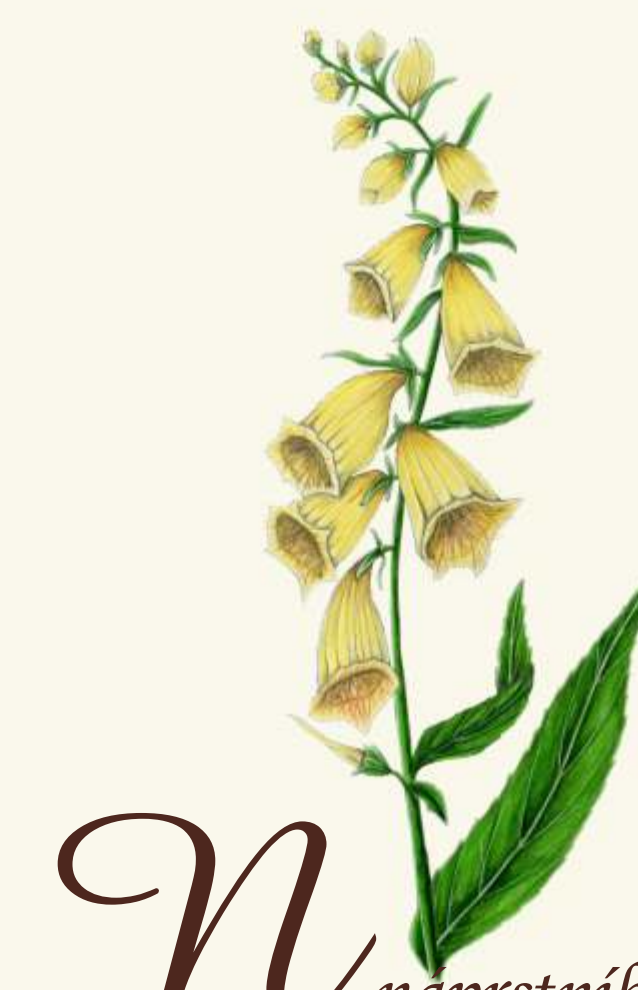
N náprstník velkokvětý ( Digitalis grandiflora )

- tzv. divoká ovce, dovezena do Dolního Slezska v roce 1901. Berani mají rohy, myslivecky nazývané toulce, připomínající vzhledem šnečí ulitu.