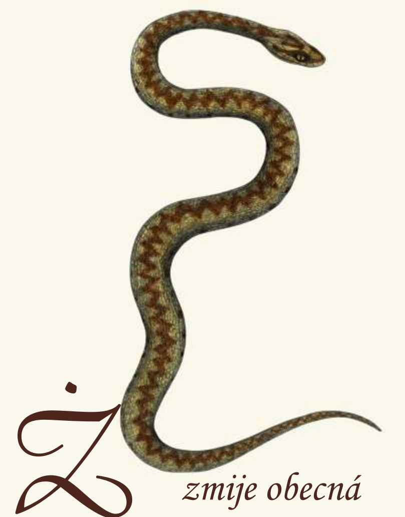
Z zmije obecná ( Vipera berus )

- drobná kapradina, jejich dlouhé listy jsou pokryté výtrusy. Odolná vůči nepříznivým povětrnostním podmínkám.