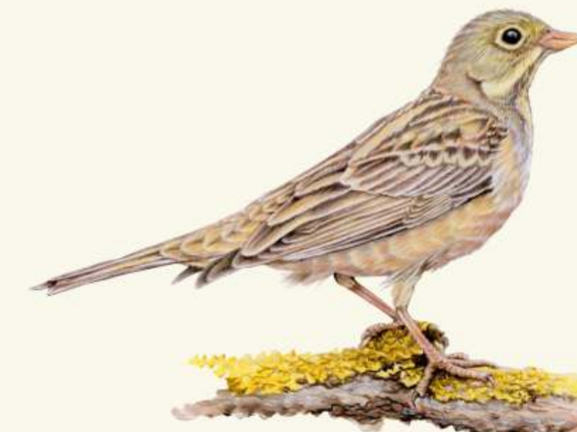
O strnad zahradní ( Ortolan emberiza hortulana )

- prudce jedovatá rostlina. Do Polska přivezena ze středozápadní Asie.