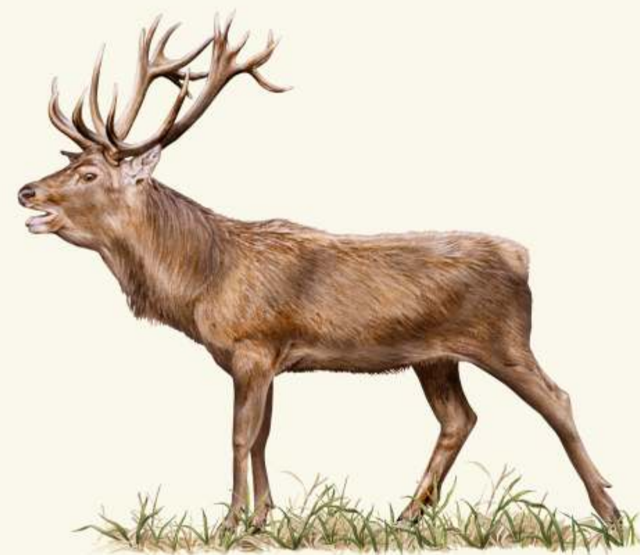
J jelen evropský ( Cervus elaphus )

- dekorativní, přísně chráněná rostlina. Zapsaná na polském červeném seznamu kriticky ohrožených druhů.